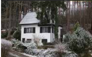
Svinětice, chata u rybníka

Prodej chaty (76 m 2 ) u rybníka Rozboud nad řekou Blaníci. V suterénu 2 místnosti (sklad, sklep), v přízemí předstíň, 2 místnosti, kuchyňka a koupelna se sprch. koutem a WC. V patře 2 ložnice a terasa. Topení ústřední z kachlových kamen (záložní olejový kotel), voda z vrtu. Venkovní krb s terasou.