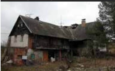
Miletínky, klid v přírodě

Prodej původního domu s hospodářskou stavbou na pozemku s celkovou výměrou 1.132 m 2 . El. přípojka, užitková voda, septik. Dům před zásadní rekonstrukcí. Okraj neprůjezdné obce s výhledem na Šumavu. Klid, příroda. Možnost příkoupení pozemku.