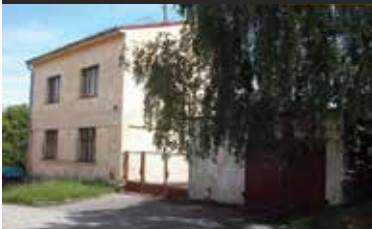
Netolice, RD se zahradou a garáží

RD se zast. plochou 125 m 2 , se vzrostlou zahradou (643 m 2 ) a samostatnou garáží s dílnou (31 m 2 ). 2 NP s dispozicí 2+1 se soc. zařízením, spíž, sklípek se studnou a kotelnou, kolna na dřevo. Napojeno na veřejné sítě vody, kanalizace a el. Dům k zásadní rekonstrukci v klidné části města 25 km od ČB.