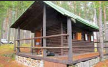
Husinec, chata u přehrady

Prodej dřevěné srubové chaty na exkluzivním místě na břehu přehradní nádrže Husinec. Zastavěná plocha 32 m 2 . 2 místnosti, terasa, kamna na tuhá paliva, možno připojení na el. proud. Klidné místo bez možnosti další okolní zástavby. Vhodné pro rybář a rekreaci.