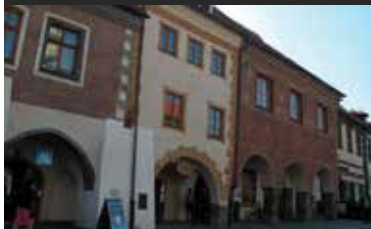
Prachatice, dům na náměstí

Prodej historického měšťanského domu na náměstí po kvalitní rekonstrukci (zast. plocha 70 m 2 ). 1-NP prodejna a sociální zařízení. 2. NP – komerční prostor – kancelář. 3. NP – otevřená místnost s kvalitní kuchyní a koupelna. Podkrovní s otevřeným stropem. Klenutý sklep – vinotéka.