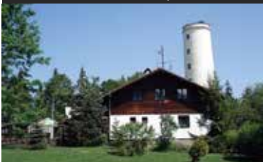
Prachatice - Libín, horský hotel

Prodej horského hotelu 10 km od města Prachatice, na vrcholu masivu Libín (1096 m.n.m.) vedle rozhledny a lanového parku. Celková výměra pozemků 2,034 m 2 . Komplex tvoří restaurace, ubytování, zimní terasa, technická budova, hřiště. Přístup po asfaltové komunikaci. Vlastní voda.