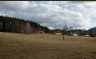
Prachatice, exkluzivní parcela

Prodej pozemku (2003 m 2 ) na exkluzivním místě s výhledem na město Prachatice, územním plánem určeno k výstavbě 1 rodinného domu. Mírný svah pod lesem, západní expozice, možnost připojení na el. rozvod, průzkumný vrt na pozemku. Hezké místo v kontaktu s přírodou i městem.