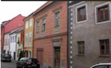
Prachatice, historický dům s byty

Prodej domu v histor. centru města v uliční frontě renesanční zástavby. 2 NP, podkrovní, sklepy, dvorek. Započatá rekonstrukce (stav. povolení, projekt. dokumentace, nová střecha, fasáda, výkladec, vyklizení) na byt. dům (1x mezonet, 4x malé byty), provozovna. El. proud, voda, kanalizace, možnost plynu.