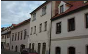
Prachatice, bydlení a podnikání

Prodej domu v histor. jádru města. Dům je součástí řadové uliční zástavby se započatou rekonstrukcí. V přízemí nebyt. prostory k podnikání, v 1. a 2. patře 2 velké byty. Nová střecha, stavební povolení a dokumentace. Možnost parkování u ulice. Ideální příležitost pro bydlení spojené s podnikáním.