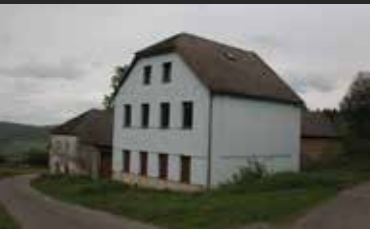
Klenovice u Mičovic, zem. usedlost

Původní zemědělská usedlost se zahradou na návsi malé chalupářské obce. Dispozice: dům s navazující maštali, kolna, sklep, dvorek, výminek. Voda obecní se studnou před domem, kanalizace septik, el. přípojka. Započatá rekonstrukce. Možnost dotvoření dispozic. Možnost dokoupení navazujících pozemků.