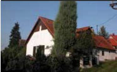
Bavorov, rekreační chalupa

Rekreační chalupa v obci Bavorov. Dvoupodlažní domek 4+1 s letním podkrovím, částečně podsklepený, nové krovy, střecha a izolace. Přistavěná garáž a kůlna na nářadí. Domek je udržovaný, v dobrém stavu. Krásné klidné místo na okraji obce, zeleň, u řeky Blanice a u rybníka (není v záplavové oblasti).