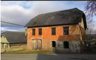
Boubská, bývalý výměnek

Prodej původního výměnku se započatou rekonstrukcí na RD na návsi malé obce 1 km od města Vimperk. Zastavěná plocha 85 m 2 , navazující plocha s plechovou garáží cca 350 m 2 . Po dokončení vhodné k trvalému bydlení nebo jako rekreační chalupa na Šumavě s výhodou zázemí blízkého města.